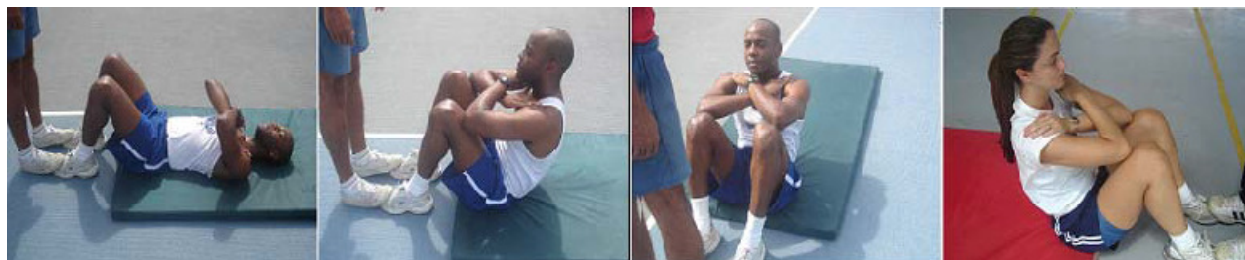
Figura 02: Flexão do tronco sobre as coxas para os sexos masculino e feminino

f) retirar ou arrastar o quadril do solo durante a execução do exercício.