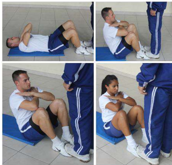
Figura 02: Flexão do tronco sobre as coxas

Obs: Neste teste, serão exigidos os mesmos padrões de execução para ambos os sexo