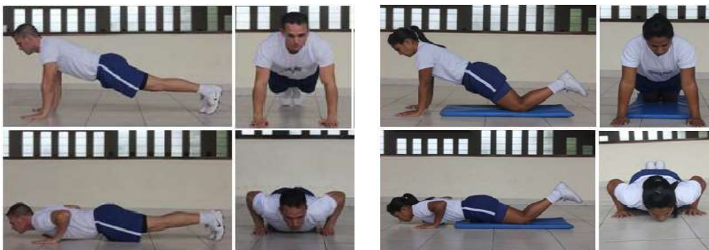
Figura 1: flexão e extensão dos membros superiores com apoio de frente sobre o solo Obs: Neste teste, existem padrões de execução diferenciados para cada sexo (masculino ou feminino)

Obs.: O aplicador de TACF deverá interromper o teste quando o voluntário alcançar o índice previsto.